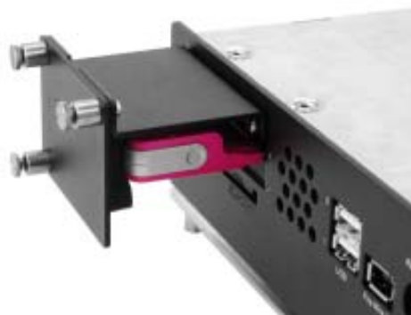
Frontansicht DeltaCar-PC mit PCMCIA Halterung