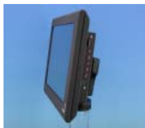
DeltaVarioMon II 10,4" XGA

DeltaVarioMon II in den Größen 6,3", 6,5", 8,4", 10,4", 12,1" Helligkeitsregelung über Potentiometer, TouchScreen Oberfläche optional via PS/2 Interface Aluminiumgehäuse mit Softhaptikbeschichtung Eingangsspannung: 7 bis 24VDC