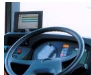
DeltaVarioMon II 6,5" VGA Applikationsbeispiel ÖPNV